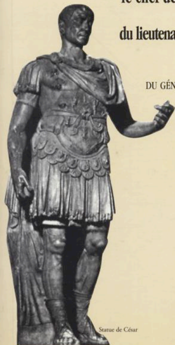
Statue de César