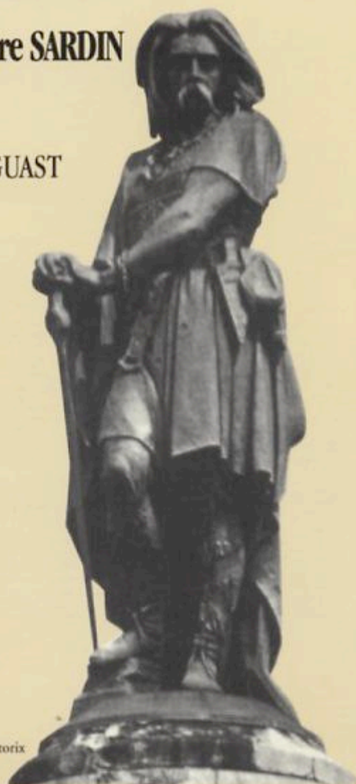
Statue de Vercingétorix