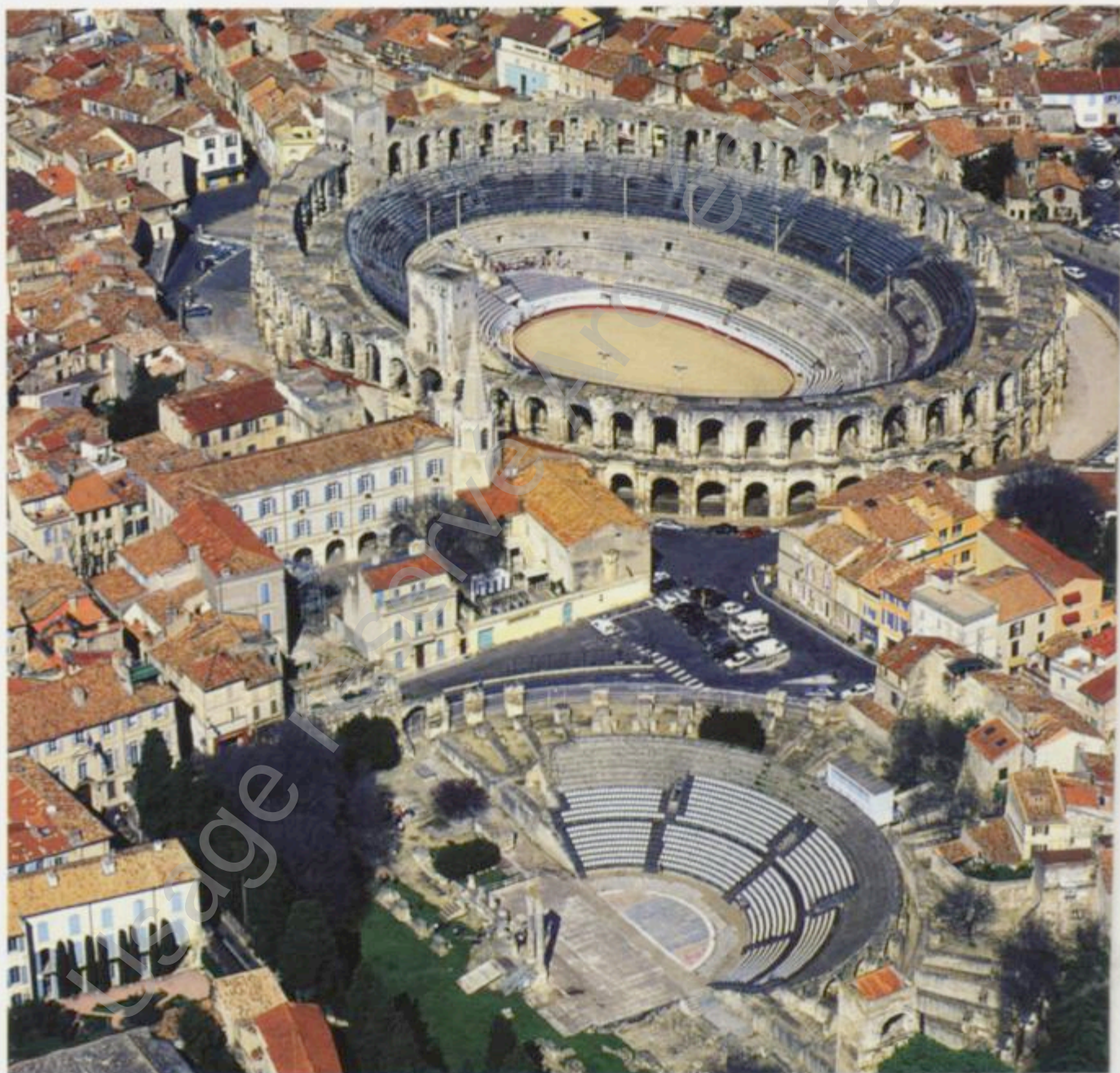
Arles Les arènes et le théâtre.