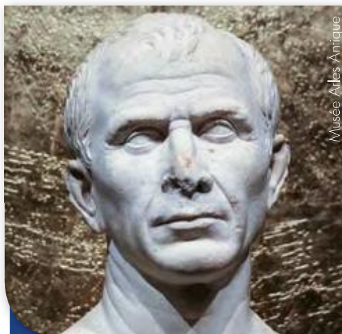
Buste en marbre dit « de Jules César », découvert en 2007 dans le Rhône à Arles. Après la victoire de César, l'administration romaine va estomper une civilisation gauloise que l'on sait aujourd'hui plus avancée qu'on ne le pensait.

où personne n'avait imaginé placer Alésia, un site apparut. Une imposante masse montagneuse de près de 250 mètres, verrou sur la route blanche menant vers Genève et la Province. Un oppidum imprenable d'une dimension adaptée aux masses en présence. Avec tout autour, tous les éléments décrits par les historiens antiques : collines, plaine, rivières, escarpements, emplacements pour les camps, tout y était... Tout y était mais seulement sur la carte : qu'en était-il sur le terrain ?