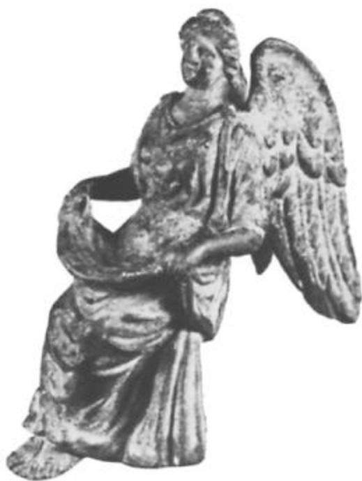
◀ Petite déesse ailée en bronze trouvée dans un sous-sol du Quartier au sud-est du Forum.