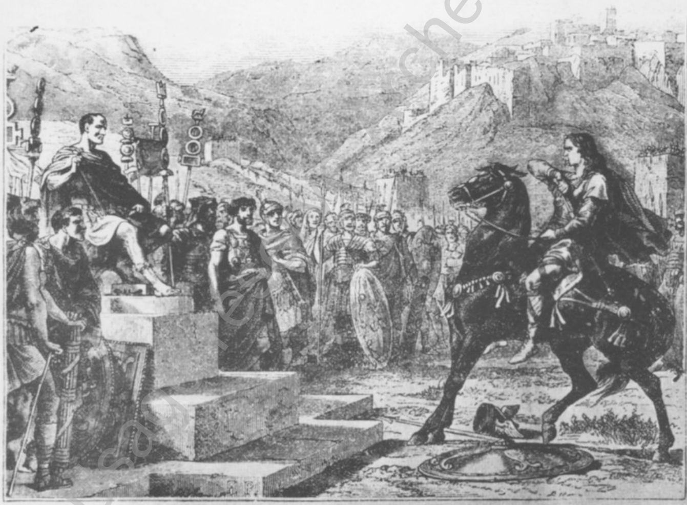
Vercingétorix se rendant à César

Inventeur de la thèse : ALÉSIA = SALINS LES BAINS