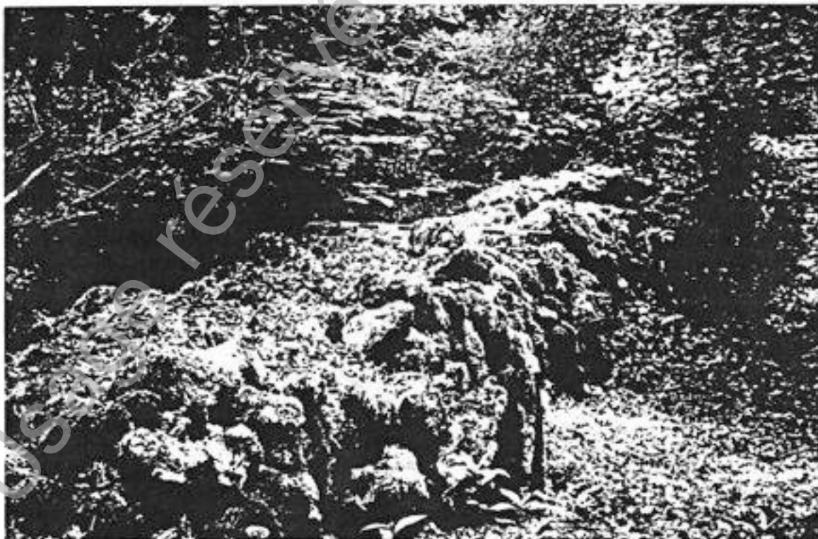
Mur inférieur filant "sur la Singe", ancré sur le mur dit "de la Combette"

Nota: Les notations, dans le texte, du type (op.cit.) indiquant qu'il faut se reporter à la bibliographie qui est, dans cette intention, placée en tête de nos exposés.